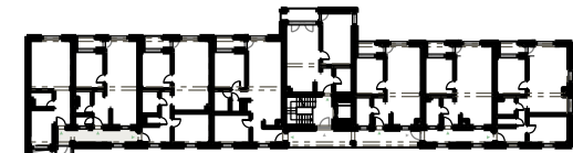
SITUÁCIA / SITE PLAN